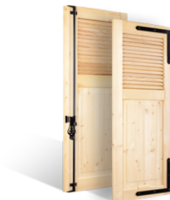
VOLETS BATTANTS 32mm à LAMES à L'AMÉRICAINNE AU TIERS en BOIS EN SAVOIR PLUS