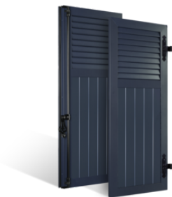
VOLETS BATTANTS 33mm à LAMES à L'AMÉRICAINNE AU TIERS en ALUMINIUM EN SAVOIR PLUS