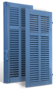
VOLETS BATTANTS CANNES à LAMES à L'AMÉRICAINNE en BOIS EN SAVOIR PLUS