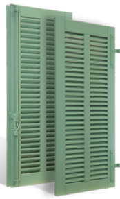
VOLETS BATTANTS MENTON à LAMES à L'AMÉRICAINNE en BOIS EN SAVOIR PLUS