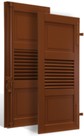
VOLETS BATTANTS COLMAR à LAMES à L'AMÉRICAINNE en BOIS EN SAVOIR PLUS