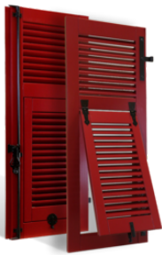
VOLETS BATTANTS NIÇOIS à LAMES à L'AMÉRICAINNE en BOIS EN SAVOIR PLUS