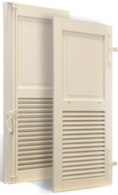
VOLETS BATTANTS GRASSE à LAMES à L'AMÉRICAINNE en BOIS EN SAVOIR PLUS