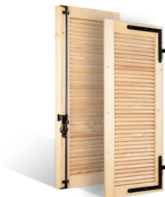
VOLETS BATTANTS 32mm à LAMES à L'AMÉRICAINNE en BOIS EN SAVOIR PLUS